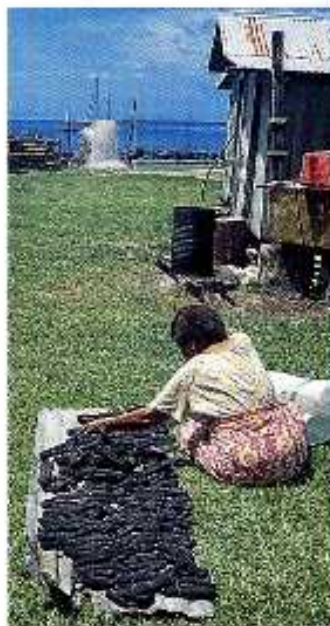
Fidži: Beqan saari. Keitetyt merimakkarat kuivataan auringossa ja toimitetaan Japaniin. Nacevan kylässä on 200 asukasta, kauppa ja hirkko. Vesi +26 astetta. Ei muita vierasveneitä.