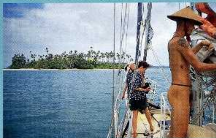
Saavimme yhdelle lukemattomista Indonesian auboista saarista Päiväntasaajalla. Vesi +27. Ei muita vierasveneitä.