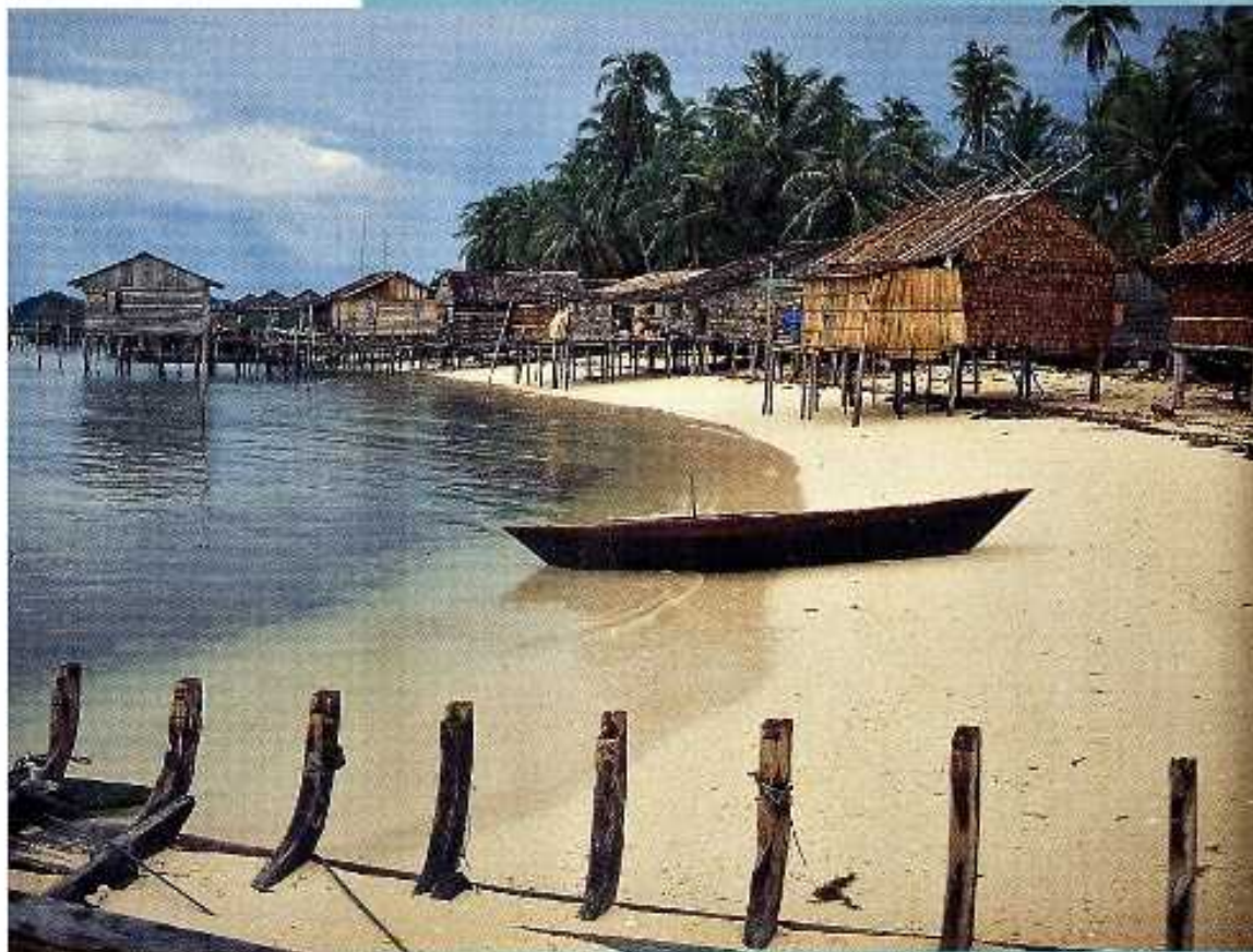
Indonesia: Päiväntasaajan kylä Pena'ah. 300 asukasta. Kaksi kauppa. Muslimiminareetti. Laituri ylävedellä. Vesi +27. Kaksi kuukautta aikaisemmin oli pysähtynyt kolmen veneen ryhmä.

Maapallosta on tehty paljon merikarttoja amerikkalaisten, ranskalaisten ja englantilaisten voimin. Useimmin käytetään Englannin Amiraalitein 5 500 kartan valintalettoa (Maritum/Krause). Minulla on mukana 350 karttaa. Olsin hyllyt toimeen paljon vähemmällä, mutta hyvällä kartalla on tietysti turvallista ja etenkin huonoissa