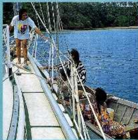
Tonga: Yavaun saaristo. naiset ovat tulleet myymään yhden kalan, muutaman sitruunan ja banaania. Vesi +23. Pääkaupunki Neiafussa 70 vierasveneitä. Muilla saarilla yksittäisiä tiloja ja kymmeniä vierasveneitä ankkuriissa.